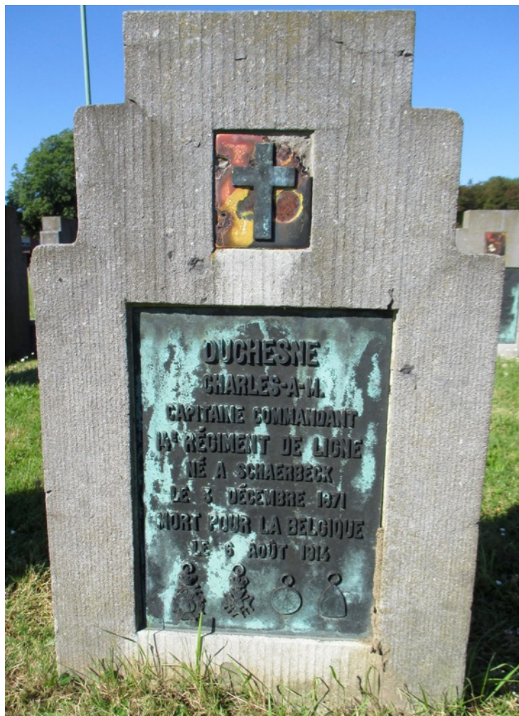
La tombe de Charles Duchesne au cimetière de Robermont. Parcelle 163-14 tombe 5.

Comme si cela ne suffisait pas, le curé, le bourgmestre et quelques habitants sont pris en otage : entre le 7 et le 12 août, ils doivent marcher vers le fort de Chaudfontaine en précédant les Allemands et servent ainsi de bouclier humain.